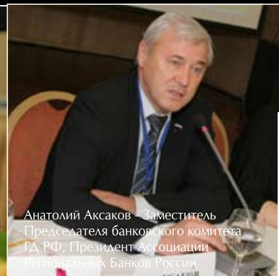
Анатолий Аксаков – Заместитель Председателя банковского комитета ГД РФ, Президент Ассоциации Региональных Банков России